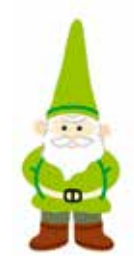
νάνος του κήπου