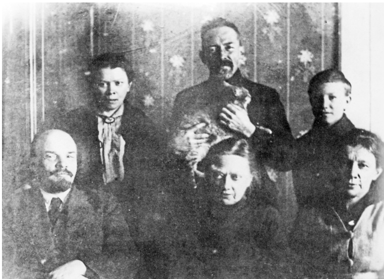
Οι Ουλιάνοφ που βρίσκονται στη ζωή το 1920. Από αριστερά προς τα δεξιά: Βλαντίμιρ, Μαρία, Ντιμίτρι, Ναντιέζντα Κρούπσκαγια (η σύζυγος του Λένιν), Γκεόργκι Λοζγκάτσεφ (υιοθετημένος γιος της Άννας) και Άννα.

ρασαν την τακτική παραδοσιακή οργάνωση της κοινωνίας κατά αξιώματα και σοσλόβιε (νομικώς καθορισμένη κοινωνική θέση για τον αγρότη, τον έμπορο, τον αστό, τον ευγενή). Αυτοί μετέφεραν τον ύπουλο ιό της ενοχλητικής σύγκρισης με τη Δυτική Ευρώπη. Απαιτούσαν μια ελευθερία δράσης που το αυταρχικό σύστημα δεν μπορούσε να τους παραχωρήσει. Δεν ήταν ποτέ ικανοποιημένοι και έμοιαζαν να μπορούν να γίνουν εξτρεμιστές οποιαδήποτε στιγμή. Έτσι η Ρωσία έφτιαχνε σχολεία για αυτούς, ενώ έπειτα τους ταλαιπωρούσε και τους εξόργιζε. Τους καλούσε να υπηρετήσουν την πατρίδα, και μετά τους φερόταν σαν να ήταν παραστρατημένα παιδιά.